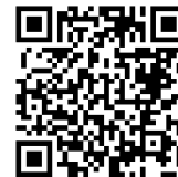
桃園市公立及非營利幼兒園 招生網